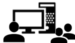
サーバー管理、監視

【内容】Web入力管理システム 【言語】JAVA 【OS】Windows 【サーバー】SQLServer